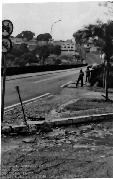
Foto 01: demonstrando extravasamento de esgoto sanitário do bueiro da SABESP.

Em atendimento à denúncia, a equipe técnica da Agência Ambiental realizou vistoria no local no dia 22/05/2025, ocasião em que flagrou excessivo extravasamento de esgoto sanitário, com forte odor característico a partir de um bueiro com escoamento significativo e visível por toda a Avenida até desovar numa boca de lobo, provocando a contaminação da rede de drenagem pluvial. No local estavam presentes 02 (dois) funcionários de empresa terceirizada da SABESP, porém, até o final da vistoria nenhuma obra de reparo havia começado. A situação fica mais alarmante considerando que tal irregularidade já tinha sido observada em vistoria anterior no dia 14/05/2025, caracterizando reincidência específica.