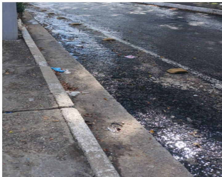
Fls. 4. Auto de Infração Penalidade Multa AIPM nº 228.2025 de 16/05/2025,

Fls.4. Vistoria em 14/05/2025, constatando extravamento de efluente de rede de esgoto, conforme Relatório de Inspeção nº 01.PE.228.2025 de 14/05/2025.